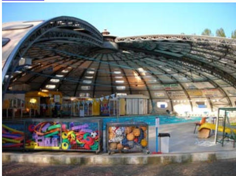
Piscine municipale de Granville