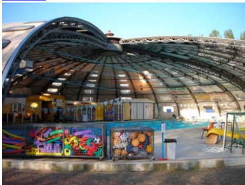
Piscine municipale de Granville